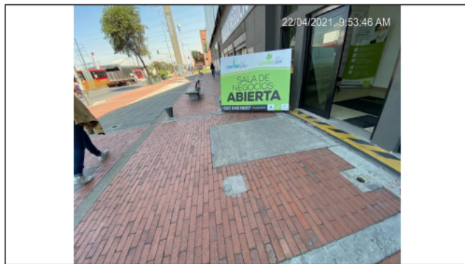
PEV en espacio público.